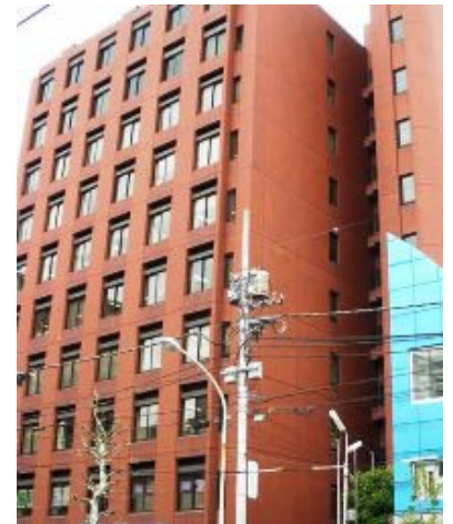
荒川サテライトのあるセントラル荒川ビル

荒川サテライトには職員1名が常駐し、教員・技術職員もすぐに対応できる体制を整えております。技術的なこと、経営に関すること、なんでも、お気軽にご活用ください。荒川区以外の皆さんも大歓迎です！