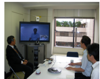
遠隔システムによる技術相談・講義も可能